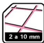
Betumação de juntas

30 cores. Textura lisa. Para juntas de 2 a 10 mm de largura.