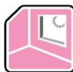
Paredes e pavimentos interiores